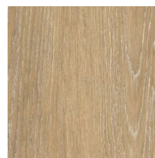
Buff 64140 LRV 28.3 | L* 60.17 V2 - Slight Variation