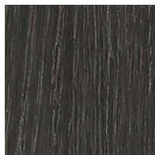
Char 64549 LRV 7.1 V2 - Slight Variation