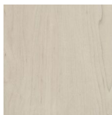
Alabaster 64114 LRV 42.4 | L* 71.17 V3 - Moderate Variation