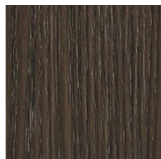
Chickory 64752 LRV 6.9 | L* 31.68 V2 - Slight Variation