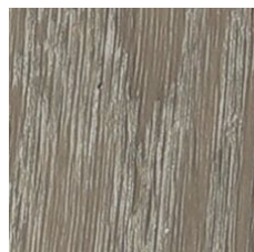
Ashen 64155 LRV 27 | L* 59 V2 - Slight Variation