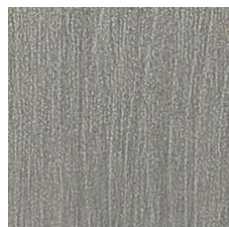
Mercury 64530 LRV 25.5