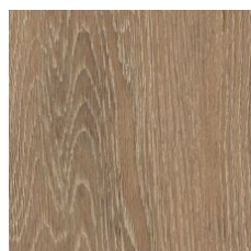
Cocoa 64103 LRV 21 | L* 52.91 V3 - Moderate Variation