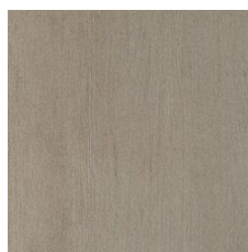
Glow 64105 LRV 37.1 | L* 67.33