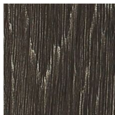
Russet 64760 LRV 7.4 | L* 32.69 V2 - Slight Variation