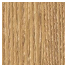
Honey 64240 LRV 26 | L* 58.01 V2 - Slight Variation