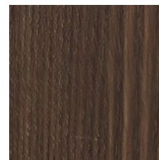
Clove 64740 LRV 7.7 | L* 33.32 V2 - Slight Variation