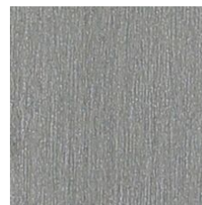
Alloy 64515 LRV 37.4 | L* 67.56