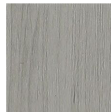
Weathered 64518 LRV 29.5 | L* 61.24 V2 - Slight Variation