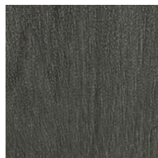
Cinder 64557 LRV 16.6 | L* 47.78