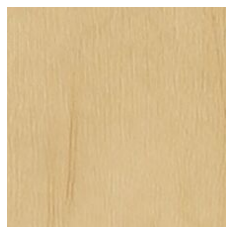
Bare 64200 LRV 39.1 | L* 68.82 V2 - Slight Variation