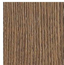
Bark 64720 LRV 12.5 | L* 41.94 V2 - Slight Variation