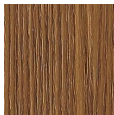
Ginger 64820 LRV 15.2 | L* 45.94 V2 - Slight Variation