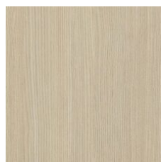
Parchment 64111 LRV 43.4 | L* 71.79 V2 - Slight Variation