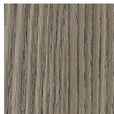
Antler 64761 LRV 18.4 V2 - Slight Variation