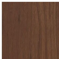
Earthen 64710 LRV 10 | L* 37.92 V3 - Moderate Variation