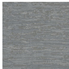
Talc 33535 LRV 18.9 | L* 50.62