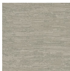
Alabaster 33111 LRV 24.3 | L* 56.41