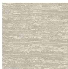
Carrara 33100 LRV 46.6 | L* 73.95