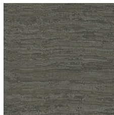
Cornerstone 33555 LRV 8.1 | L* 34.24