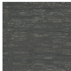
Slate 33595 LRV 5.9 | L* 29.24