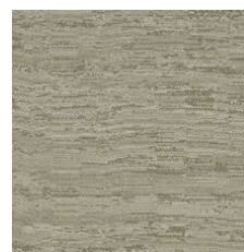
Element 33506 LRV 18.6 | L* 50.19