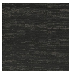
Onyx 33505 LRV 2.2 | L* 16.3