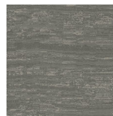
Forge 33518 LRV 12.9 | L* 42.62