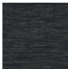
Colossal 33496 LRV 3.3 | L* 21.34