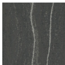
Slate Palladium 33595