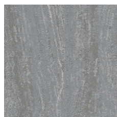
Talc Platinum 33535