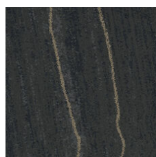
Colossal Bismuth 33496