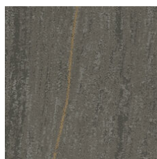
Cornerstone Copper 33555