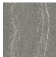
Forge Platinum 33518