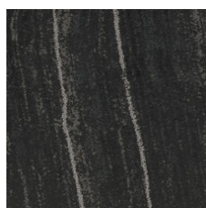
Onyx Silver 33505