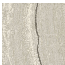
Carrara Silver 33100