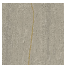
Alabaster Gold 33111