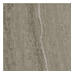
Element Platinum 33506