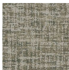
Recollect 85215 LRV 24.8 | L* 56.84