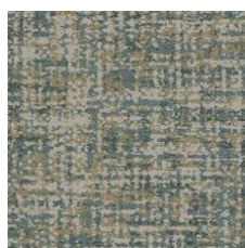
Novelty 85327 LRV 23.4 | L* 55.46