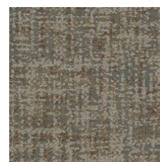
Nostalgic 85665 LRV 17.2 | L* 48.47