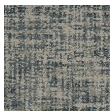
Timeless 85402 LRV 25 | L* 57.04