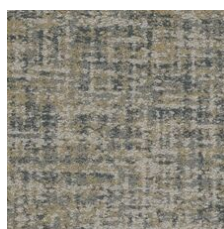
Classic 85496 LRV 22.8 | L* 54.91