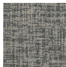
Heritage 85530 LRV 18.1 | L* 49.64