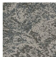
Heritage 85530 LRV 15.4 | L* 46.21