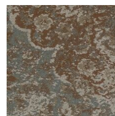
Nostalgic 85665 LRV 14.7 | L* 45.26