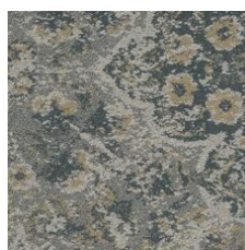
Classic 85496 LRV 23.6 | L* 55.66