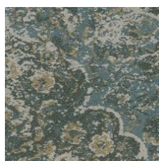
Novelty 85327 LRV 21.2 | L* 53.15