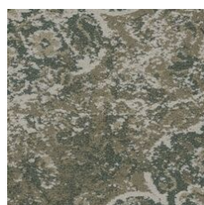
Recollect 85215 LRV 24.4 | L* 56.5