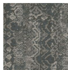
Heritage 85530 LRV 14.6 | L* 45.03