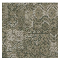
Recollect 85215 LRV 21.3 | L* 53.3