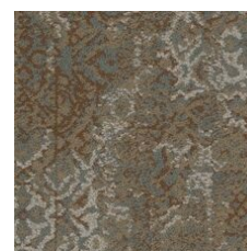
Nostalgic 85665 LRV 16.2 | L* 47.22