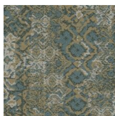
Novelty 85327 LRV 18.2 | L* 49.74