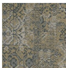
Classic 85496 LRV 19.1 | L* 51.67