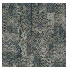
Timeless 85402 LRV 18.6 | L* 50.23