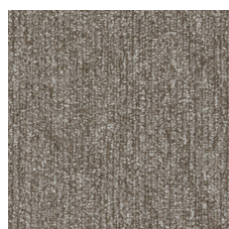
Impact 97100 LRV 21.7 | L* 53.7