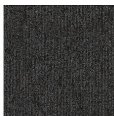
Contribute 97500 LRV 4 | L* 23.79