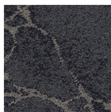
Lazurite Silver 21496 LRV 5.8 | L* 28.97