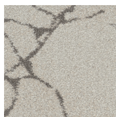
Carrara Silver 21100 LRV 41.1 | L* 70.27