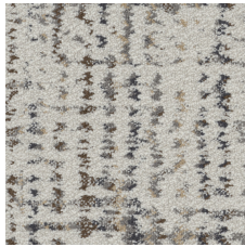
Untitled 24105 LRV 39.4 | L* 69.03