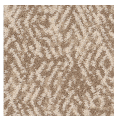
Jute 38111 LRV 34.6 | L* 65.41