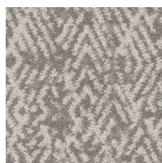
Wool 38100 LRV 36.5 | L* 66.93