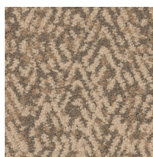
Flax 38770 LRV 26.2 | L* 58.24