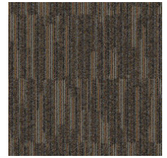
Cast Bronze 92601