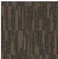
Cast Bronze 92601