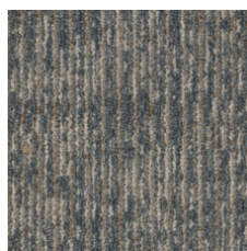
Essay 75429 LRV 18.1 | L* 49.68