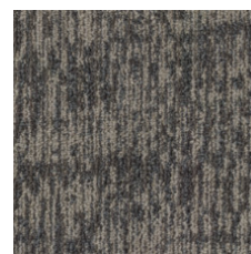
Edition 75585 LRV 9.9 | L* 37.61