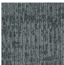
Repertoire 75325 LRV 12.7 | L* 42.24