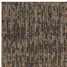
Symbolism 75770 LRV 12.2 | L* 41.58