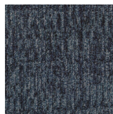
Anthem 75486 LRV 6.9 | L* 31.65