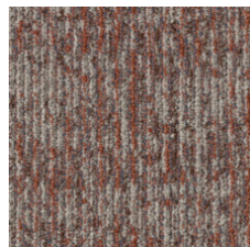
Irony 75860 LRV 18 | L* 49.52