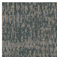
Allusion 75400 LRV 14.9 | L* 45.53