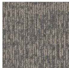
Stylus 75761 LRV 18.2 | L* 49.77