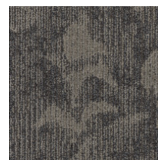
Edition 75585 LRV 12.1 | L* 41.39