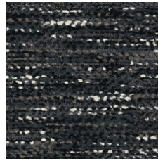
Vibrant Mole 81500