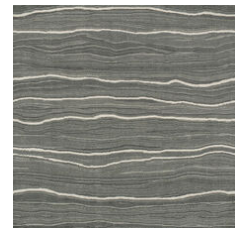
Forge Platinum 20518 LRV 11.1 | L* 39.75