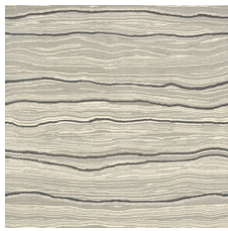
Carrara Silver 20100 LRV 48.8 | L* 75.33