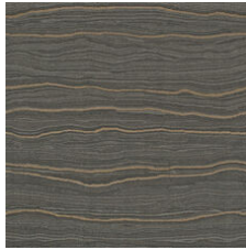
Cornerstone Cop 20555 LRV 7.8 | L* 33.57