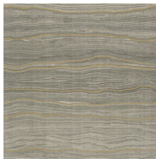
Alabaster Gold 20111 LRV 20.4 | L* 52.33