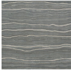
Talc Platinum 20535 LRV 17.6 | L* 49.04