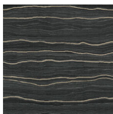
Colossal Bismut 20496 LRV 2.5 | L* 17.71