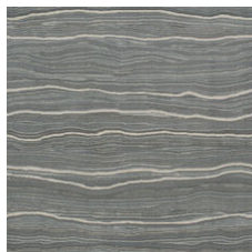
Talc Platinum 20535 LRV 17.6 | L* 49.04