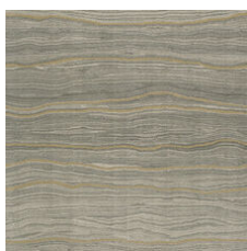
Alabaster Gold 20111 LRV 20.4 | L* 52.33