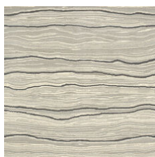
Carrara Silver 20100 LRV 48.8 | L* 75.33