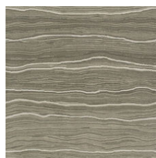
Element Platinu 20506 LRV 15.7 | L* 46.62