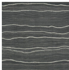
Slate Palladium 20595 LRV 5 | L* 26.77