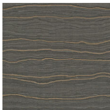
Cornerstone Cop 20555 LRV 7.8 | L* 33.57