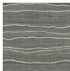
Forge Platinum 20518 LRV 11.1 | L* 39.75