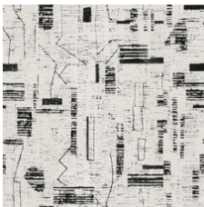
High Atlas 01100