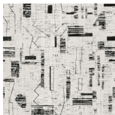
High Atlas 01100