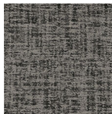
Flax 79557 LRV 10.5