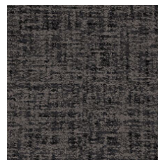
Angora 79596 LRV 7.2