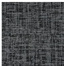
Mohair 79530 LRV 8.6