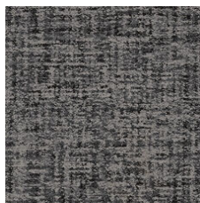
Wool 79535 LRV 13.6