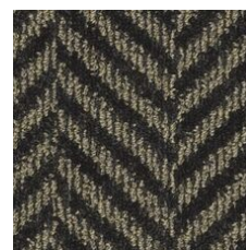
Truffle 03700 LRV 5.3 | L* 27.54