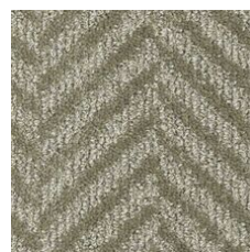
Brushed Nickel 03570 LRV 15.8 | L* 46.67