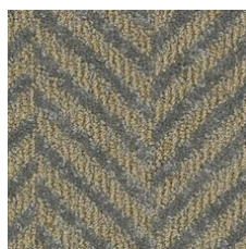
Mirrored 03525 LRV 12 | L* 41.2