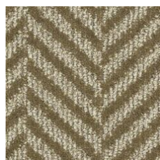
Camel Hair 03120 LRV 15.6 | L* 46.46