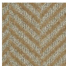
Gilded 03250 LRV 16.1 | L* 47.11