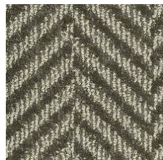
Mushroom 03750 LRV 11.4 | L* 40.3