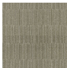
Brushed Nickel 03570