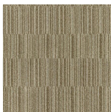
Camel Hair 03120