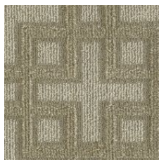
Camel Hair 03120