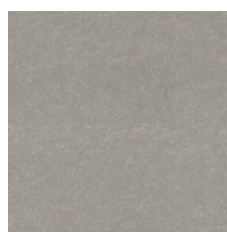
Flax 19114 Weldrod 00114