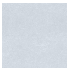
Dove 19104 Weldrod 00500