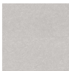
Natural 19110 Weldrod 00700