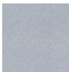
Concrete 19515 Weldrod 00515