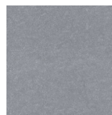
Mineral 19760 Weldrod 00550