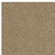
Nature Refresh 00720