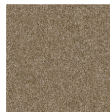
Mocha Froth 00702