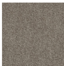
Graceful Breeze 00592