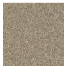
Taupe Stone 00700