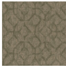
Enriched Wisdom 77330 LRV 8.8 | L* 35.57