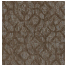
Express Gratitude 77740 LRV 13.9 | L* 44.09