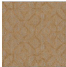
Humble Beginnin 77155 LRV 14.4 | L* 44.84