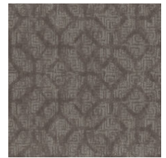
Refined Eleganc 77585 LRV 14.7 | L* 45.29