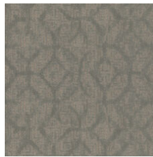
Self Reflection 77484 LRV 10.1 | L* 38