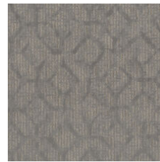
Major Milestone 77515 LRV 15.7 | L* 46.6