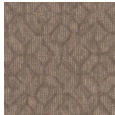
Warm Intentions 77761 LRV 18.6 | L* 50.25