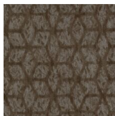
Express Gratitude 77740