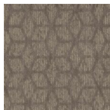
Warm Intentions 77761