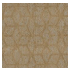
Humble Beginninn 77155