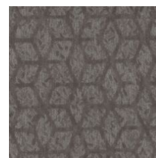
Refined Eleganc 77585