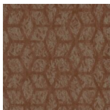
Adventurous Spi 77665