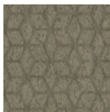
Enriched Wisdom 77330