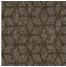
Express Gratitude 77740