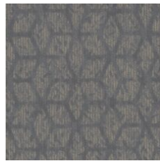
First Impressio 77402