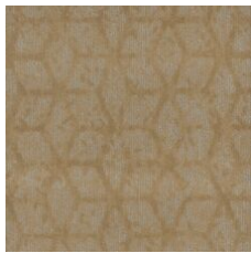
Humble Beginninn 77155