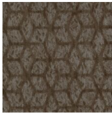
Express Gratitude 77740