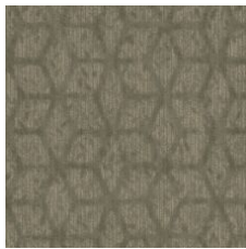
Enriched Wisdom 77330