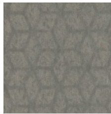
Self Reflection 77484