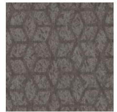
Refined Eleganc 77585