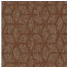
Adventurous Spi 77665